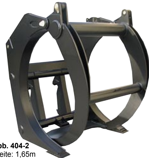
Abb. 404-2 Breite: 1,65m Querschnitt: 2,4m 2